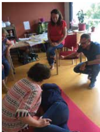
Formation Éducation à la santé familiale