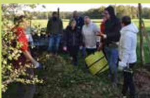
« Réaliser une « lasagne » dans son jardin »