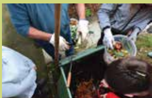
« Mélanger votre composteur régulièrement avec des outils pratiques »