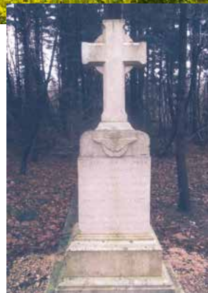
la croix des aviateurs

S'il reste une maison du XVI e siècle, les vestiges d'une parcelle Gallo-romaine ont été découverts par l'INRA et l'ONF.